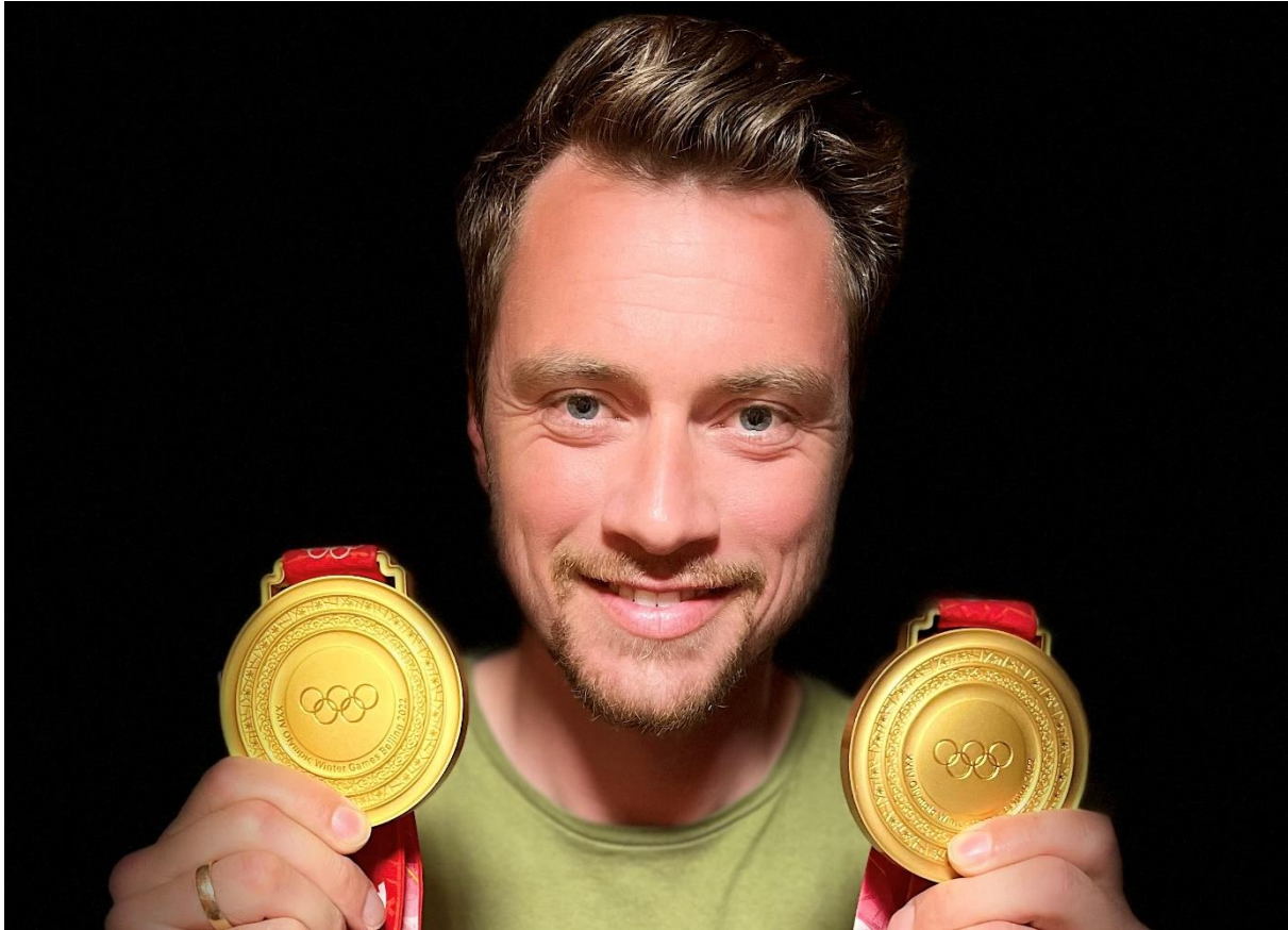
Goldjubiläum in Peking 2022.